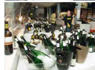
PROFIL-DAC-TEST AUF DEM „BADESCHIFF“ Unter Kostleiter Robert Steidl (oben Mitte) wurden 100 Weine verkostet.